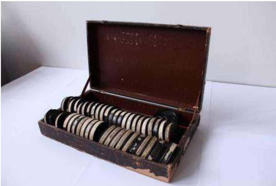
Une mallette de bobineaux de films en 9,5 mm