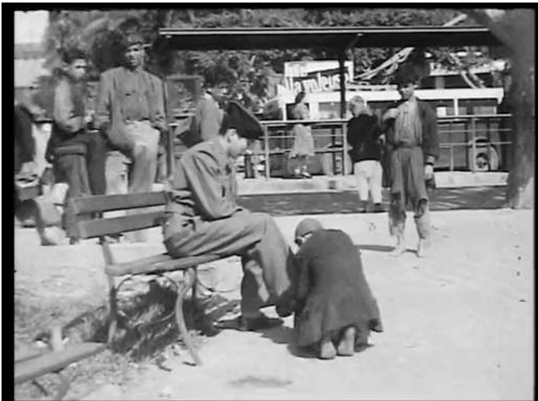
Légende 2 : Grâce à la présence française en Algérie, les enfants ont du travail.