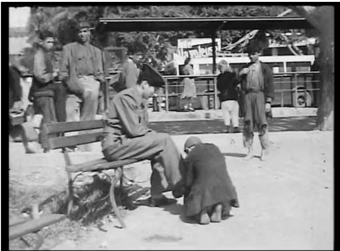
Légende 4 : Algérie, 1948, un pays colonisé. _