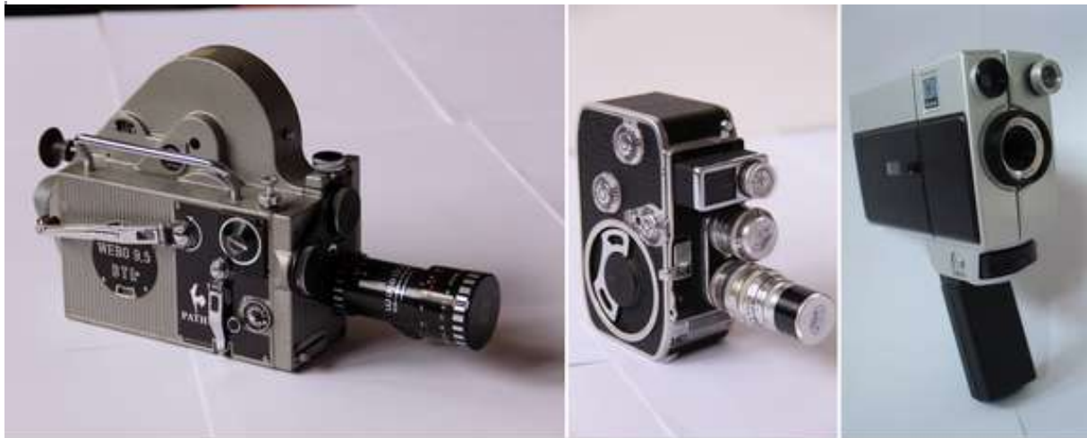
De gauche à droite : caméras 9,5 mm Pathé Webo, 8 mm Paillard Bolex B8 et Super 8 Kodak.