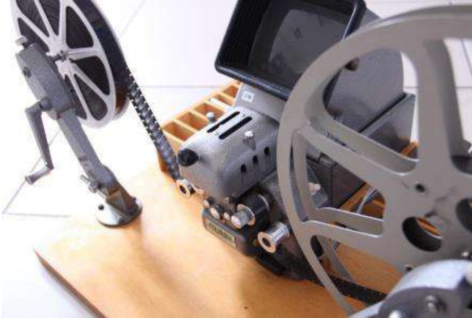
La visionneuse permet de faire défiler la pellicule image par image. Le mouvement est activé manuellement : on peut ainsi contrôler la vitesse de défilement de la bande.