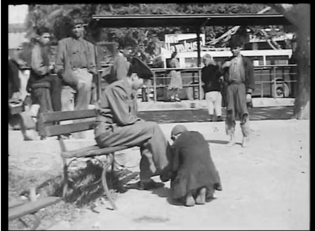
Légende 1 : Sous la menace de deux hommes, un soldat se fait voler ses chaussures en pleine rue.